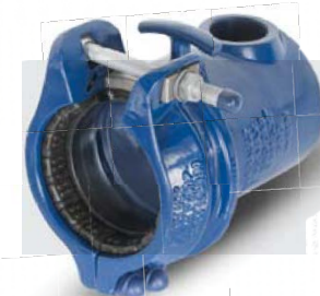
HYMAX GRIP® végsapka