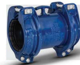
HYMAX GRIP® tok-tokos