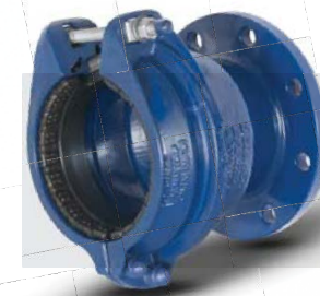
HYMAX GRIP® tok-karimás